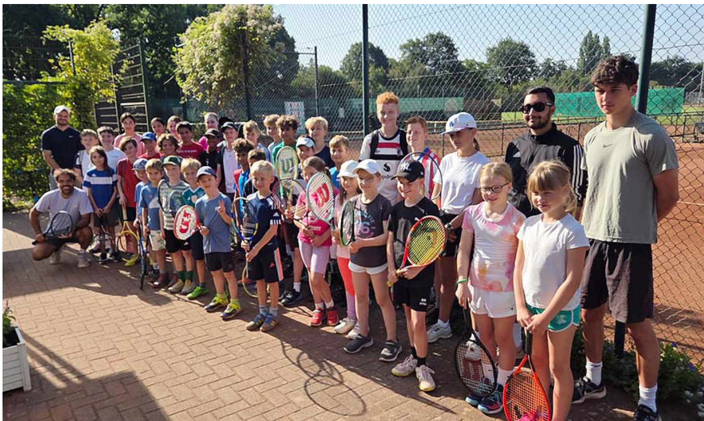
BTC-Tenniscamp 2025 – die teilnehmenden Kinder mit Trainern

Das Tenniscamp fand in den ersten drei Ferientagen (11.–13. August) statt. Mit knapp 40 teilnehmenden Kindern und fünf Trainern war es erneut eine sehr gelungene Veranstaltung. Wie immer stand der Spaß am Tennis im Mittelpunkt.